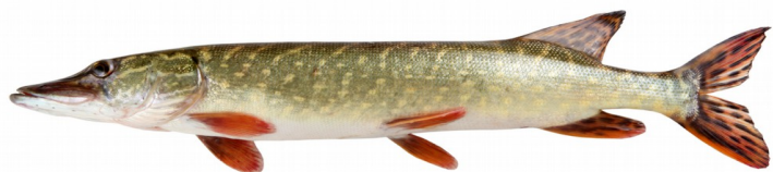
Gädda /Hecht /Broci/ Pike /Snoek