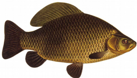
Ruda /Karausche /Crucian carp