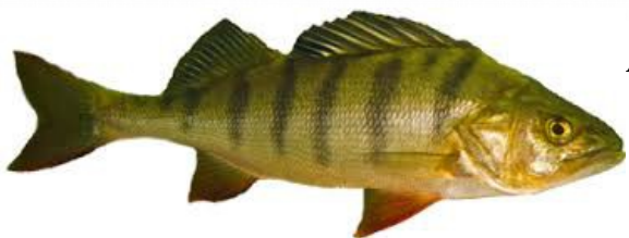
Abborre / Barsch /Perche / Perch /Baars