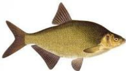
Braxen /Brassen/ Bream /Bras